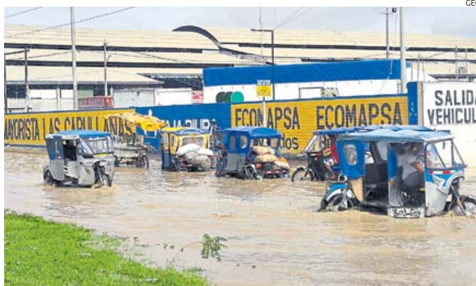
El Niño. Mypes con problemas ocasionados por el desastre natural deben entre S/ 30,000 y S/ 40,000.

La norma aprobada por el Legislativo establece la creación de un plan de rescate financiero para estas mypes morosas, que les permita refinanciar sus deudas y acceder nuevamente a préstamos del sistema financiero. Para ello, el Ejecutivo,